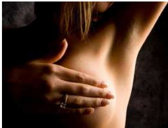
Han sido identificadas nuevas claves para evitar la metástasis en el cáncer de mama.

Descubrimientos ciencia | Ciencia médica | Cáncer de mama